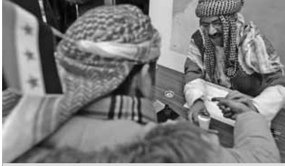
موظف مشرف على الانتخابات ينصح أحد المقترعين.

أن يؤدي هذا النظام أيضا إلى خطأ مثلما حدث في الانتخابات الرئاسية الأمريكية عام ٢٠٠٠ في ولاية فلوريدا. وبعض الماكينات لا تترك سجلا ورقيا يمكن الرجوع إليه في حالة الطعن أو إعادة الفرز.