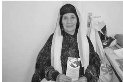
جمع أوراق التسجيل.

هل حققت جماعة كانت مغمورة قبل الانتخابات أداء قويا على نحو مفاجيء بما يشير إلى تحول سياسي في المستقبل القريب؟