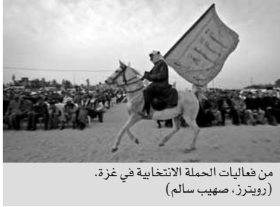
من فعاليات الحملة الانتخابية في غزة.

لبعض المسامات وراء الستار أثناء الحملة أن تدفع في نهاية الأمر ببعض اللاعبين الصغار إلى السلطة في حكومة ائتلافية.