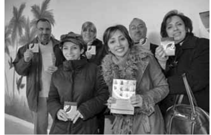
عائلة عراقية تقوم بالتسجيل للاقتراع في عمان.

وينبغي التأكد أيضا مما إذا كانت أعداد أصوات الغائبين تتطابق مع أحدث الإحصاءات عن أعداد المغتربين.