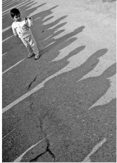
سبي يقف في ظل طابور من المقترعين في البصرة.

تستخدمها وسائل الإعلام بصورة واسعة على أساس يومي أثناء الحملة لقياس رد فعل الجمهور إزاء قضايا