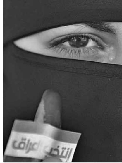
امرأة تقترع. يناير ٢٠٠٥.

ومنذ وقت الإعلان عن الانتخابات وحتى موعد إجرائها، والذي يكون عادة بين ستة وثمانية أسابيع، تتوافر فرصة كبيرة للزعماء الذين يشغلون المناصب - والذين تنتهي مدة ولايتهم - وللأحزاب، للقيام بلي اللوائح بما يخدم مصالحهم بأساليب خفية