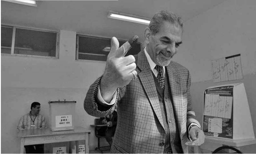
داخل مركز الاقتراع.

ويتمثل احد الحلول المحتملة في آلية استخدمتها منظمة الأمن والتعاون الأوروبي في الانتخابات المحلية في البوسنة والهرسك وفي كوسوفو عقب انهيار يوغوسلافيا حيث تضمن الحبر مادة نترات الفضة التي تظهر فقط تحت الأشعة فوق البنفسجية.